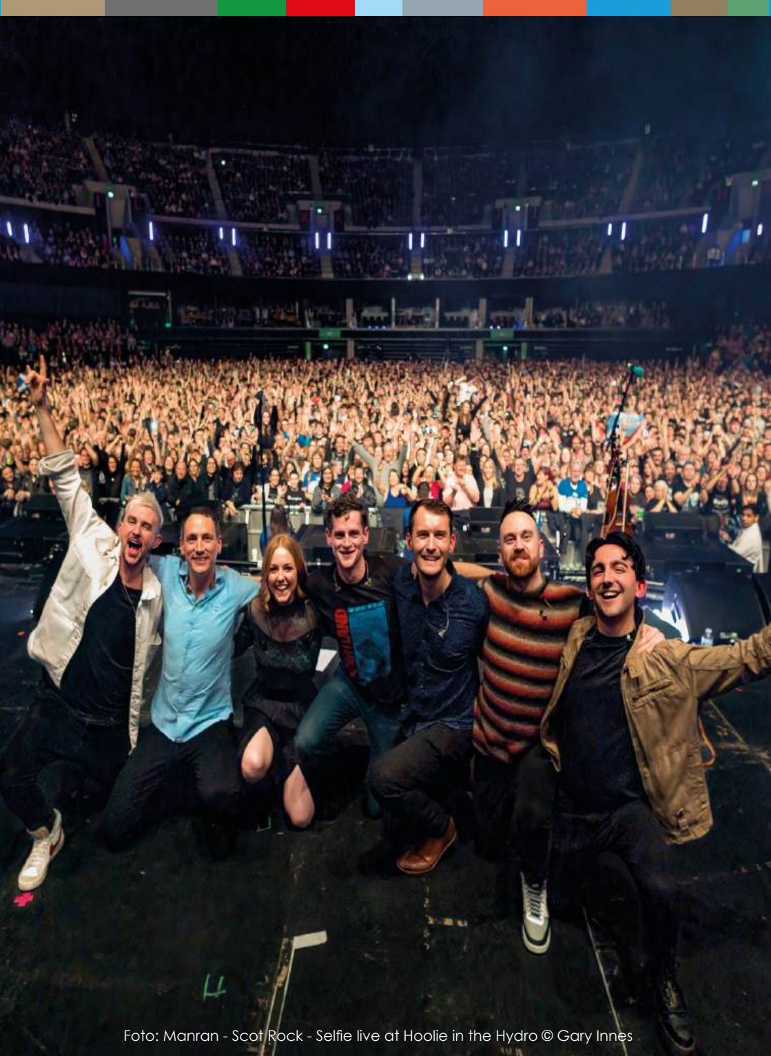
Foto: Manran - Scot Rock - Selfie live at Hoolie in the Hydro